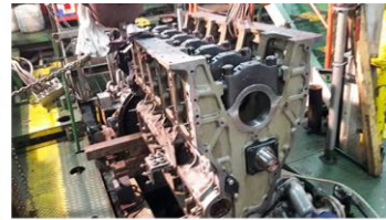
Corps et machine